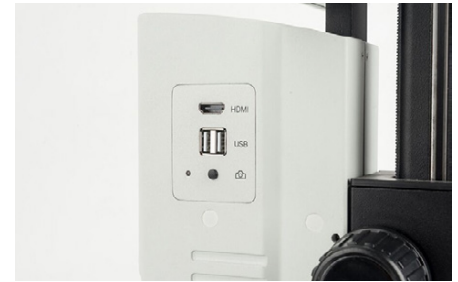
OIV 254 Bouton capture d'écran